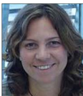
MARTA CALSINA Comunicació